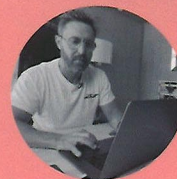
David Guetta 世界百大DJ大卫