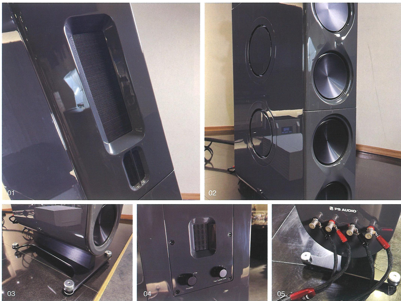
01. aspen FR30分别用上了2.5英寸及10英寸的超低质量Teonex®丝带振膜 02. 前方4枚为自家秘制8英寸长冲程低音单元，左右两侧配备了4枚10英寸平面辐射器 03. 底座采用金属铸造而成，非常稳固 04. aspen FR30后背更设有一只平面高音，提供输出电平和远近调校，用户可根据空间和自己的喜好进行调整 05. aspen Fr30提供双线分音接驳方式，方便用户把玩

半空，没有丝毫沉重感觉，只因其底部采用弧形设计，衬托修长且坚固的铝制底座，并通过合成塑材脚座或大型黄铜钉脚作为跟地板之间的耦合媒介。而在运输的时候，aspen FR30的音箱将会分成上、下两个部分，安装时，两者之间透过特制滑动组件进行结合。