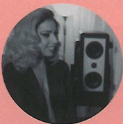
Lady Gaga 雷迪嘎嘎