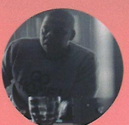
JAY Z 肖恩·科里·卡特

深圳优声美影有限公司(中国总代理) 电话: 0755-2372 3880 www.yosemine.com.cn