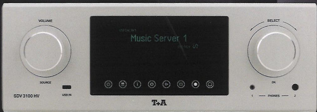
SDV 3100 HV 参考级串流数字/模拟转换器及前级放大器