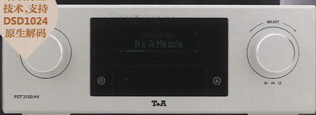
PDT 3100 HV 参考级 CD/SACD 转盘