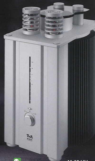
M 40 HV 旗舰单声道后级 功率放大器