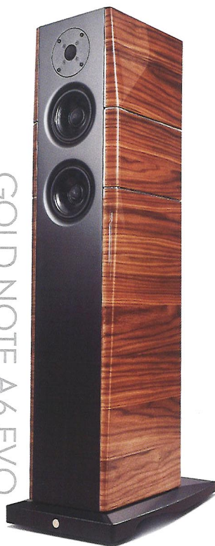
GOLD NOTE A6 EVO