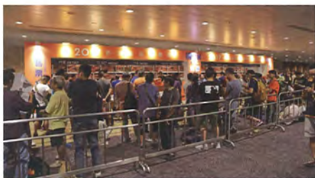
↑ 观众售票处早已经人山人海了。