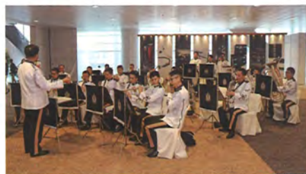
↑ 乐队一如既往地出席，为展会增添了不少音乐气氛和人气吸引力。