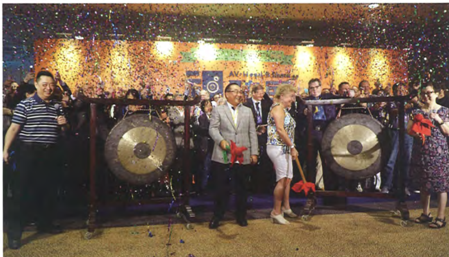
— 众多业界人士敲铜锣鼓的精彩瞬间，礼炮响起！