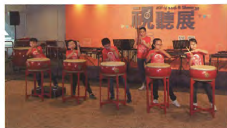
↑ 如有幸，展会期间您会碰到儿童鼓乐的演奏。