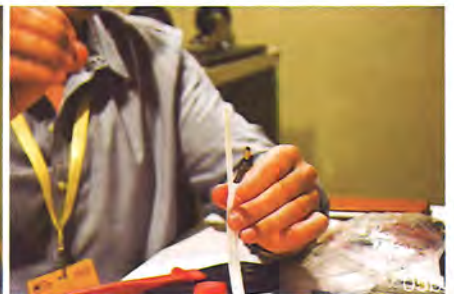
05a/b: 使用专用的钳子，只需要用力一压，即可完成制作