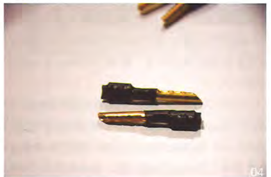
04: 这是专用的香蕉头，内部有10个尖锐的触点，只需要用钳子一压，即可将蒙皮压破，并将铜芯压紧，这是一个非常便捷的设计