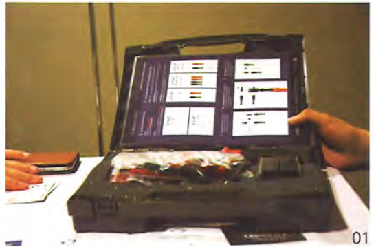
01: 这是Nordost专为散线制作成品线而设计的工具，当中包含了绝缘套、香蕉头、开线器以及钳子等