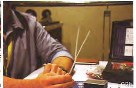
02a/b: 首先将线材通过特殊的开线器，将2 FLAT扁平线一分为二