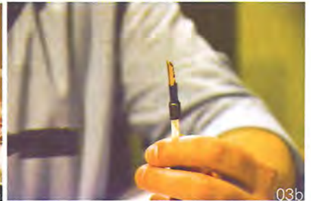
03a/b: 随后套上绝缘套，以及在线材的末端套上香蕉头（并不需要削绝缘皮）