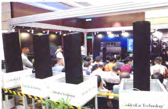
另一邊擺設GoldenEar雙聲道喇叭，將Arcam擴大機與喇叭Dolby Atmos 7.1.4效果。