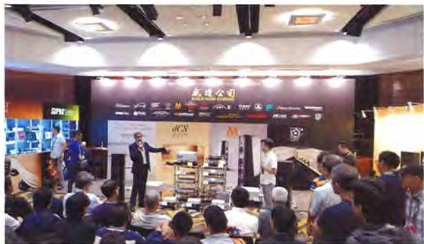
即場體驗CS Vivaldi One SACD/CD機高雅音質。

威達在4樓設置了房間，內裡滿載了其代理的產品，當中不少是身價極高的發燒級器材。場中亦特設一角，備有CD及線材等配件以優惠價售賣，吸引不少發燒友駐足。