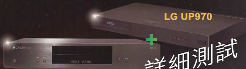
Cambridge Audio CXUHD