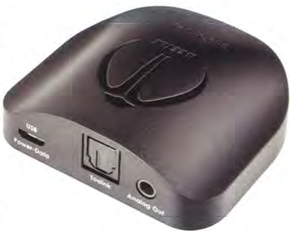
機背設有光纖和USB輸入，輸出部3.5mm模擬端子。

Beetle內的DAC仍是留著Dragonfly血統，不同的是一支USB變身為藍牙無線DAC，應用性更廣泛。只要拿出手機，通過藍牙接上Beetle播放音樂，便有著不一般音色。