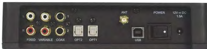
機背設有各兩組的光纖和同軸輸入端子、非同步USB、兩組RCA輸出，也有藍牙接收天線。

聆聽 iDAC II 是快樂的體驗，它相對細小的機身但做出宏大的音場，處理大聲歷時從容不迫，音色屬於溫暖、淳厚而各類段平衡度相當高。以此價位，但獲得近 Hi-end 門檻表現，平復何求？