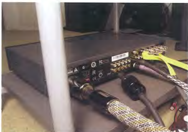
▲邊聽邊玩，為A29升級Isoclean Super Focus Mk2電源線，動力更從容後勁更凌厲！

備註：此特價組合只限《威達公司》尖沙咀「iSquare」及銅鑼灣「世貿中心」陳列室發售