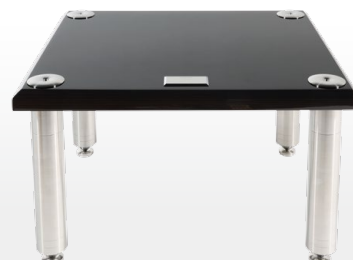
BRS Mini-EX Tall Modular Rack 高身層架