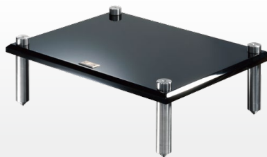
MRS-S Standard Modular Rack 標準層架