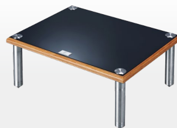
BRS-EX Tall Modular Rack 高身層架