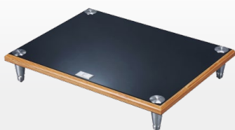
BRS-B Base Rack 可作獨立使用的底座