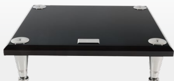
BRS Mini-B Base Rack 可作獨立使用的底座

四組承託支柱選用實芯不銹鋼車製而成，備有 190 mm (BRS Mini - S 標準層架) 及 230 mm (BRS Mini - EX 高身層架) 兩種實用高度。支柱耦合部位經過全面改良，每條承託支柱均可隨意調校高度，以便修正水平。