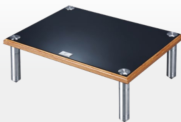
BRS-S Standard Modular Rack 標準層架