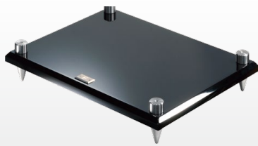
MRS-B Base Rack 可作獨立使用的底座