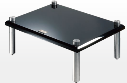
MRS-EX Tall Modular Rack 高身層架