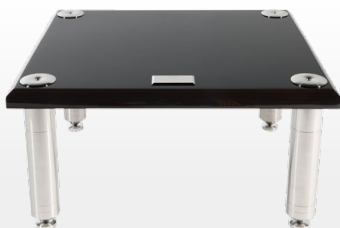
BRS Mini-S Standard Modular Rack 標準層架