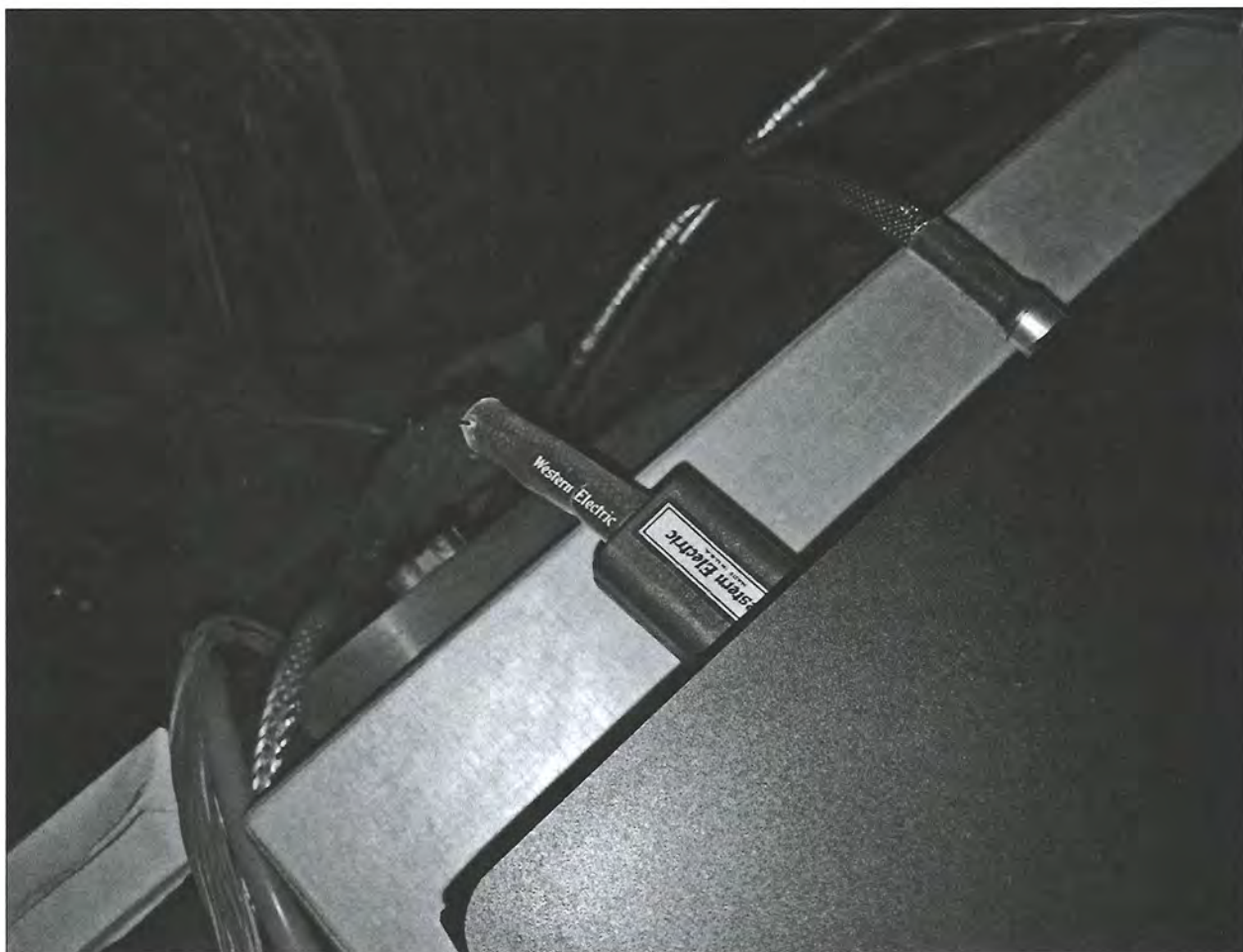
Isis 配搭《西電》電源線最正。

既然 REGA Isis 一下子成為了本社試音室的 CD 機王，那不論在公在私，都值得一再深入探討其聲音潛質，而最直接調聲方法之一，莫過於加以承釘腳座之類，反正上次測試 Apollo 時，簡單地將三枚紫銅檀