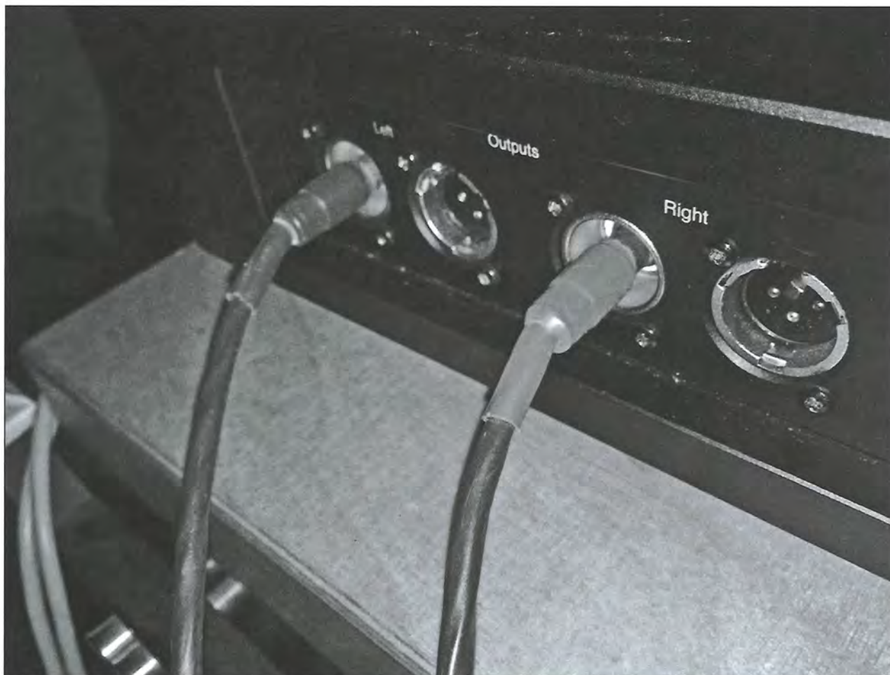
用了 ARTIST 1.5m 訊號線後，Isis 聲音平衡度更高，而音色則宜古宜今。

木腳放在其機殼上，就已經發揮效用。不過，任憑在下如何法寶盡出，Isis 都似乎不為所動，可見其堡壘式機箱，對抵抗外界諧震確實有效。