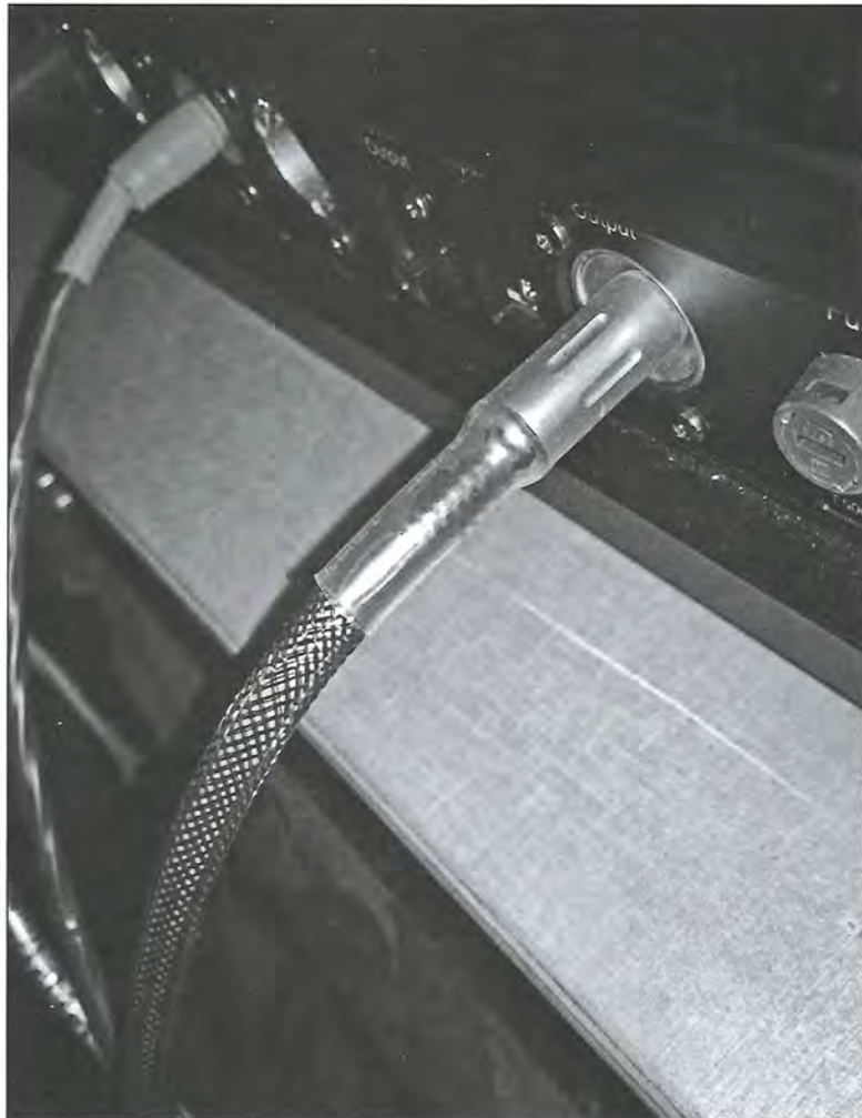
透過 Isis 的數碼輸出端進行「落地」，效果立竿見影。

其實，將 CD 機落地這一招，筆者早於前幾年測試泰國 hi-end 品牌 CLEF AUDIO 出品的 Ground Zero 地盒時已體驗過。一說到地盒，相信已即時觸動起不少讀者的發燒神經，皆因地盒正是現下最熱門的玩意之一，至於如何給 Isis 落地呢？方法十分簡單，就是透過其數碼輸出的 RCA 檔，將一條 RCA 同軸線（另一端改裝為喇叭香蕉插）接駁到地盒，而本社試音室一直沿用的地