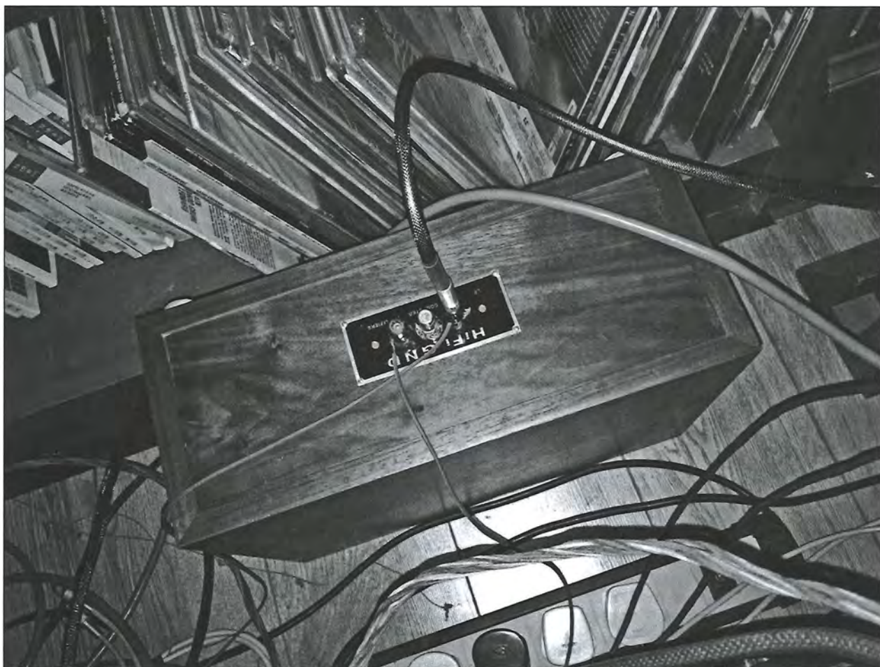
萬試萬靈的《新時》地盒。